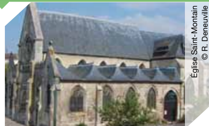
Église Saint-Montain