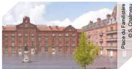
Place du Familistère

►►► Visite commentée sam et dim de 10h à