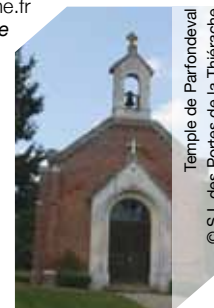
Temple de Parfondeval

>>> Visite libre et/ou commentée sam et dim de 14h à 18h (ttes les heures) (€) Gratuit