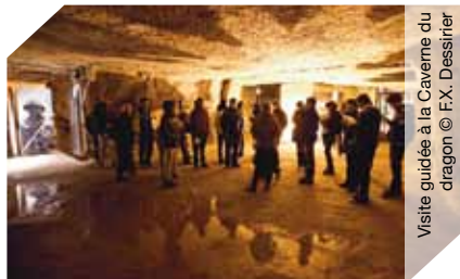
Visite guidée à la Caverne du dragon

Musée du Chemin des Dames (coordonnées GPS : Long. 3,73127/Lat. 49,44160) 03 23 25 14 18 Carrière devenue caserne souterraine pendant la Grande Guerre, ce site présente aux visiteurs de nombreuses galeries, témoins du passage des soldats. >>> Circuit du chemin des Dames à vélo (12 km) accessible à partir de 12 ans. Il est impératif de venir équipé d'un vélo (location possible à la base nautique Cap'Aisne de Chamouille.)