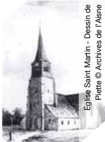
Église Saint Martin - Dessin de Piette

Exposition sur l'église de Sains-Richaumont. Le groupe d'Histoire locale démontrera que l'église a fait partie des églises fortifiées de la Thiérache.