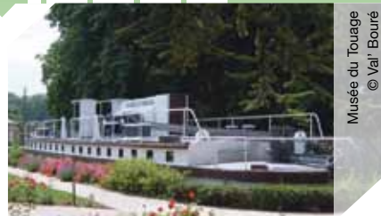
Musée du Touage

Aménagé dans un toueur de 1910, ce musée vous raconte l'histoire du canal Saint-Quentin, les techniques de tractions du halage au