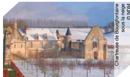
Chartreuse de Bourgfontaine sous la neige