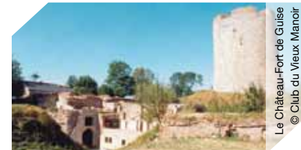
Le Château-Fort de Guise