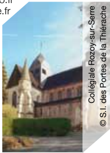
Collégiale Rozoy-sur-Serre