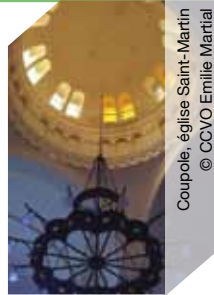
Coupole, église Saint-Martin