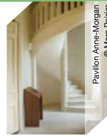
Pavillon Anne-Morgan

▶▶▶ Visite libre sam et dim de 14h à 18h