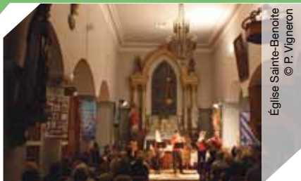
Église Sainte-Benoîte