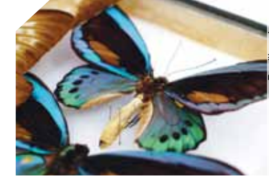
Papilio priamus (Australie Nlle-Guinée)