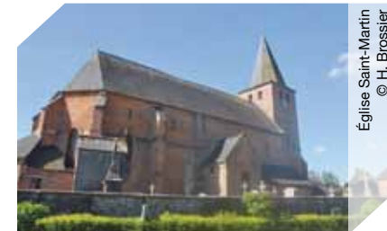
Église Saint-Martin