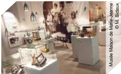
Musée Maison de Marie-Jeanne

Ⓜ Gratuit pour les enfants ; 3 € 50/adulte