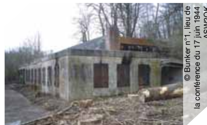
© Bunker n°1, lieu de la conférence du 17 juin 1944 ASWZOK

Découverte de l'ancien quartier général Alle-