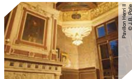
Pavillon Henri II