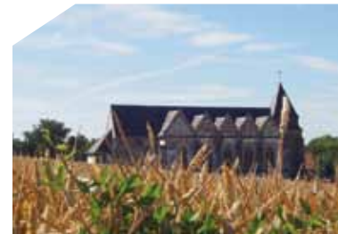
Église Saint-Quentin