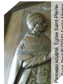
Panneau sculpté, Église Saint-Pierre-Saint-Paul

Église du XII e , XV e et XVII e s.. Mobilier intéressant inscrit aux MH : retable de l'autel