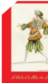
Le Ballet de La Nuit chez La Fontaine © Musée J. de-la-Fontaine

▶▶▶ Visite libre, exposition et projection « Le Ballet de La Nuit Chez La Fontaine », sam et dim de 9h30 à 12h et de 14h à 17h30 (€) Gratuit