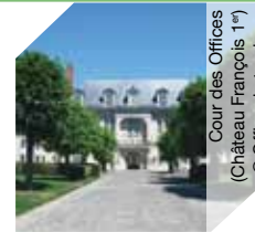
Cour des Offices (Château François 1 er )

▶▶▶ Visite commentée sam de 10h30 à 11h30 et de 14h à 17h (ttes les 30 mn) ; dim de 10h30 à 12h et de 13h30 à 16h (ttes les 30 mn) € Gratuit