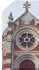
Chapelle Frédéric-Vieville

▶▶▶ Visite commentée sam et dim de 14h à 18h (€) Gratuit