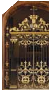
Grille de la chapelle

▶▶▶ Visite libre du site et des collections, sam de 10h à 12h ; sam et dim de 13h30 à 18h (€) Gratuit