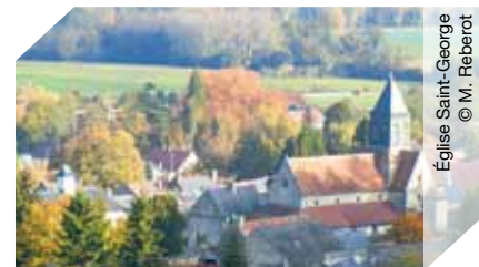
Église Saint-George