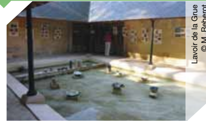
Lavoir de la Grue