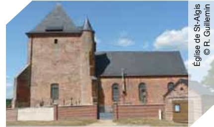
Église de St-Algis