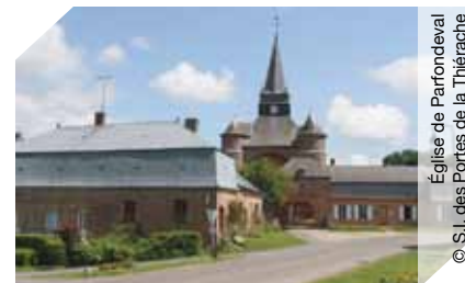
Église de Parfondeval

Place de l'Église • 03 23 98 50 39 carolinedupuy@wanadoo.fr www.tourisme-thierache.fr Église fortifiée Saint-Médard à Parfondeval. Ce village est classé parmi les « plus beaux villages de France », mais la star locale reste l'église. >>> Visite libre et/ou commentée sam et dim de 14h à 18h (ttes les heures) (€) Gratuit