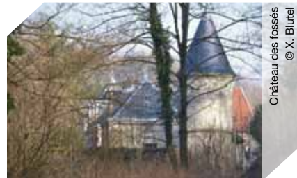
Château des fossés

🆓 Gratuit pour les -18 ans ; Individuel : 3 €/adulte ; Groupe annoncé : 2 €/adulte