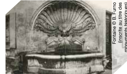
Fontaine (inscrite au titre des monuments historiques)