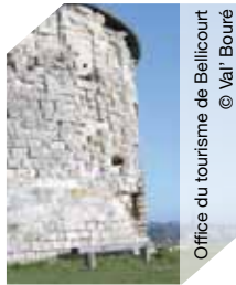
Office de tourisme de Bellicourt © Val' Bouré

En préfiguration de la réouverture du musée en 2014, le public est invité à découvrir la res-