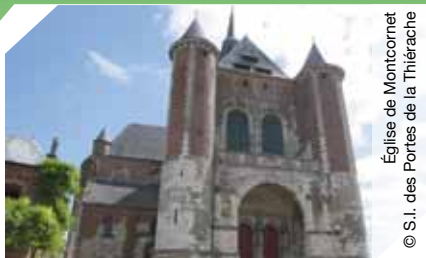
Église de Montcornet

Place de l'Église 03 23 98 50 39 carolinedupuy@wanadoo.fr www.tourisme-thierache.fr Cet ensemble architectural, du milieu du XVI e s.,