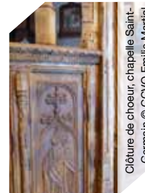
Clôture de chœur, chapelle Saint-Germain