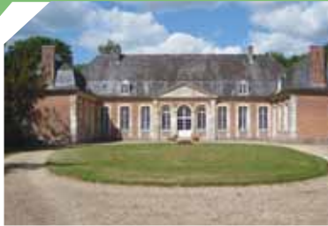
Château de Parpeville

deux ailes en retour d'équerre, couvert d'une toiture d'ardoises à la Mansart.