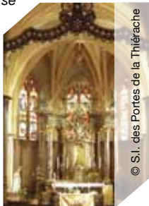
© S.I. des Pontes de la Thiérache