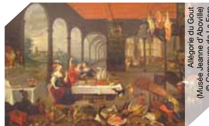
Allégorie du Gout (Musée Jeanne d'Aboville)