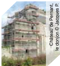
Château de Pernant, le donjon