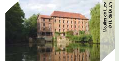
Moulins de Lucy