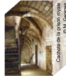
Cachots de la prison royale