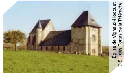
Église de Vigneux-Hocquet