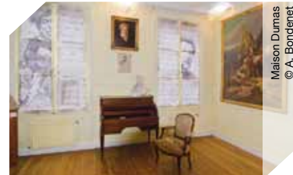
Maison Dumas © A. Bondenet