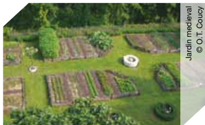
Jardin médiéval