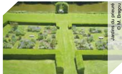
Jardins du prieuré

info@prieuredelongpre.com www.prieuredelongpre.com