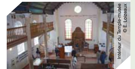
Intérieur du Temple-musée