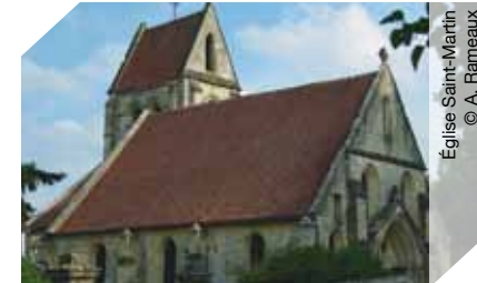
Église Saint-Martin