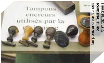
Tampons encreur utilisés par la résistance