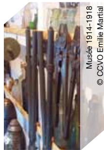
Musée 1914-1918