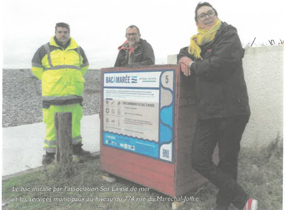
Le bac installé par l'association Sos Laisse de mer et les services municipaux au niveau du 774 rue du Maréchal-Joffre

Il s'ajoute à d'autres bacs placés sur le littoral par la Communauté d'agglomération de la Baie de Somme (voir page 16).