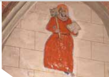
Fresque rerouvée dans le chœur

de l'Oise, 3 villages Lerzy, Sorbais et Etréaupont présentent conjointement leurs richesses patrimoniales, architecturales et naturelles.