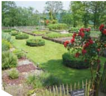
Capitulaire Charlemagne