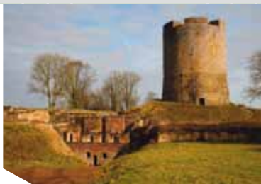
Château-fort, donjon