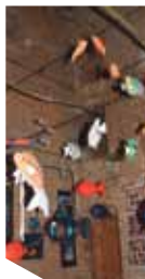
Atelier d'Art textile

Au cœur du bocage thiérachien, unis par la vallée de l'Oise, 3 villages Lerzy, Sorbais et Etréaumont présentent conjointement leurs richesses patrimoniales, architecturales et naturelles.