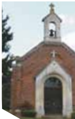
© SI des Portes de la Thiérache