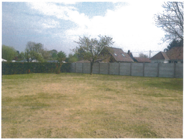
Prise de vue 4 bis