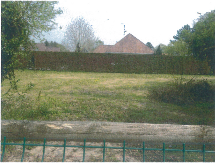
Prise de vue 1