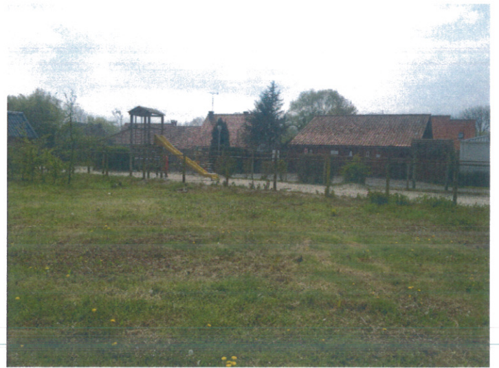
Prise de vue 3

Les terrains concernés par l'extension sont encadrés dans le camping existant au cœur d'une zone bâtie du « Vieux Fort-Mahon ».