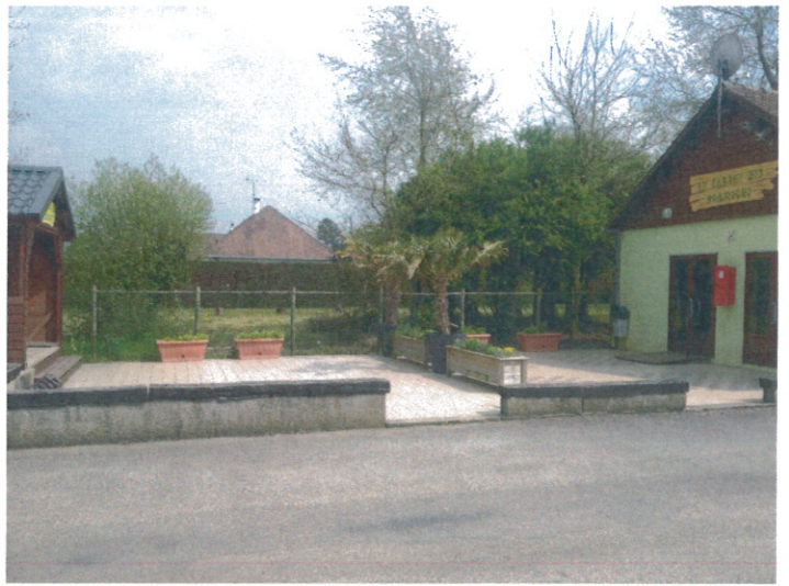
Prise de vue 1 bis