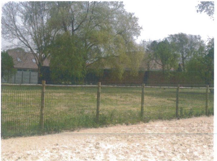
Prise de vue 6

Les terrains concernés par l'extension sont encadrés dans le camping existant au cœur d'une zone bâtie du « Vieux Fort-Mahon ».