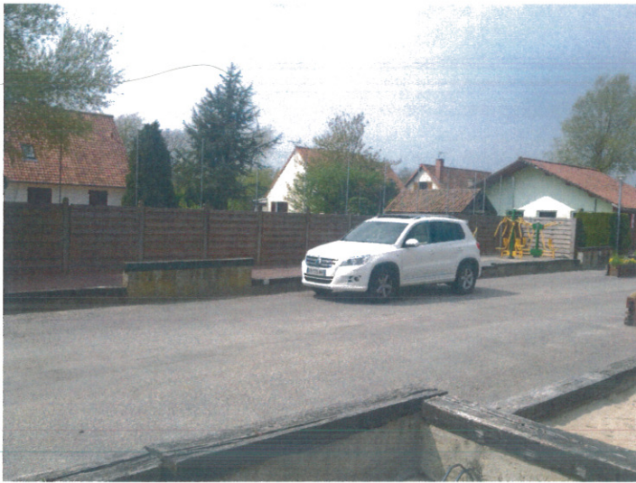
Prise de vue 2