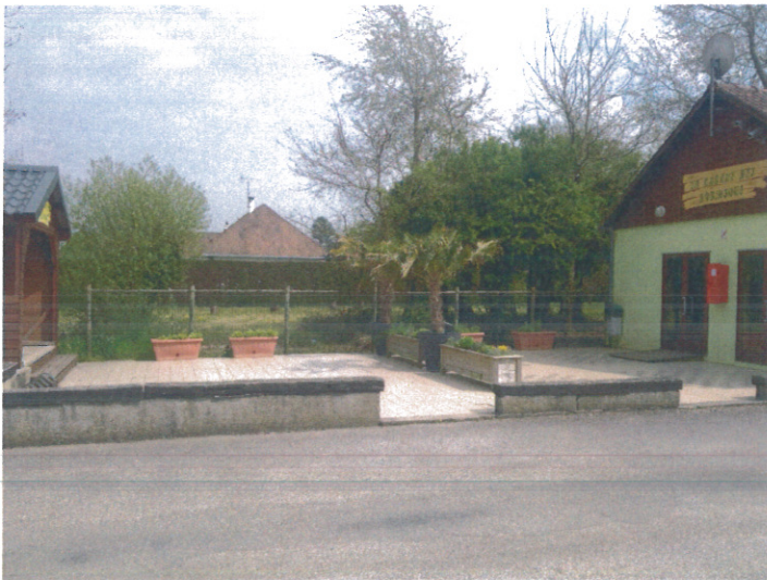
Prise de vue 5