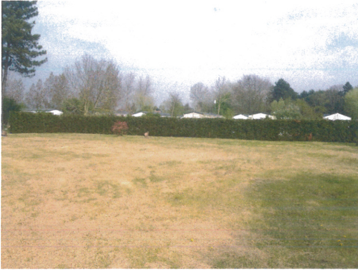
Prise de vue 4