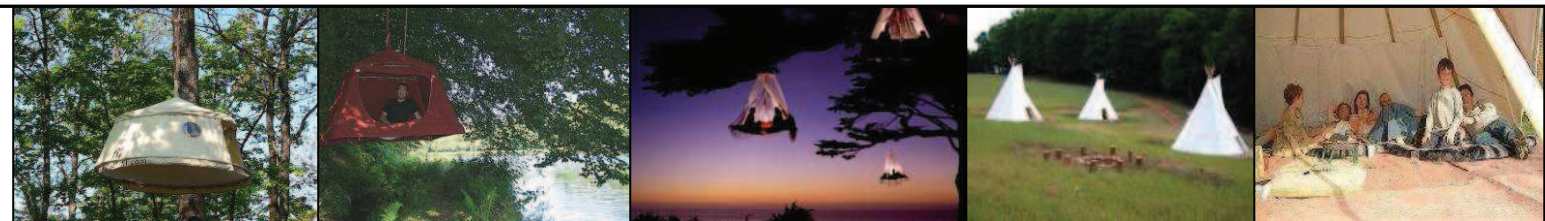
Exemples d'hébergements temporaires

A cela pourraient s'ajouter des hébergements temporaires tels que tentes suspendues, tipis et yourtes