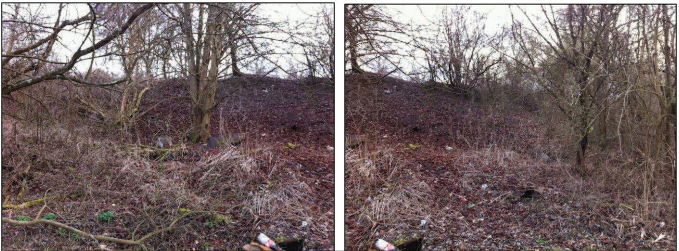
Exemples de zones à aménager : défrichage au sol

Entre contrepartie, il sera procédé à des reboisements partiels pour compenser, voire accentuer le potentiel nature de ce terrain.