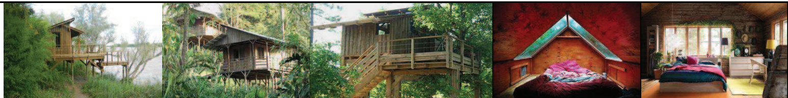
Exemples d'habitats ciblés

A cela pourraient s'ajouter des hébergements temporaires tels que tentes suspendues, tipis et yourtes