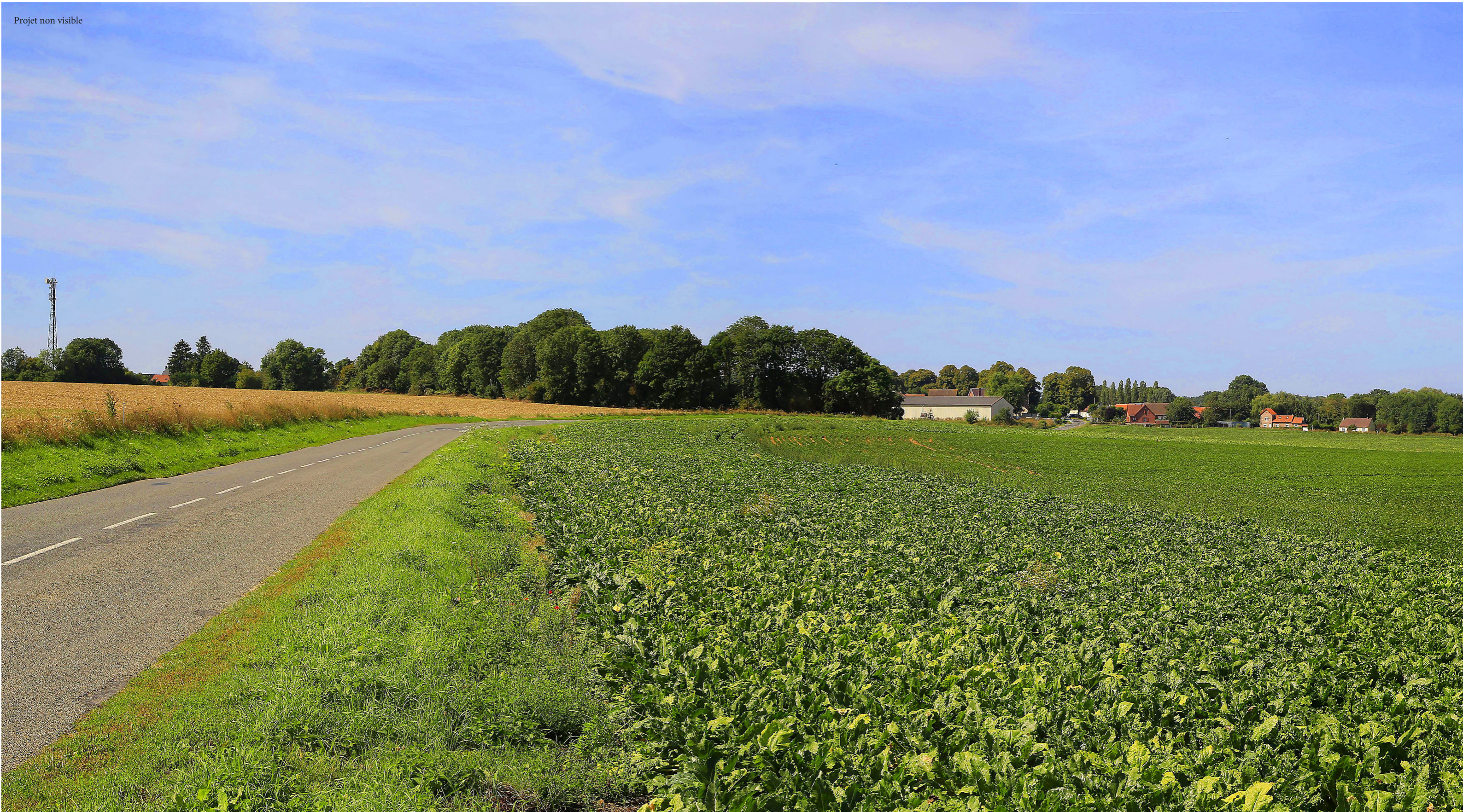
Photomontage représentant la perception terrain du projet en lisant l'image à une distance de 47,5 cm.