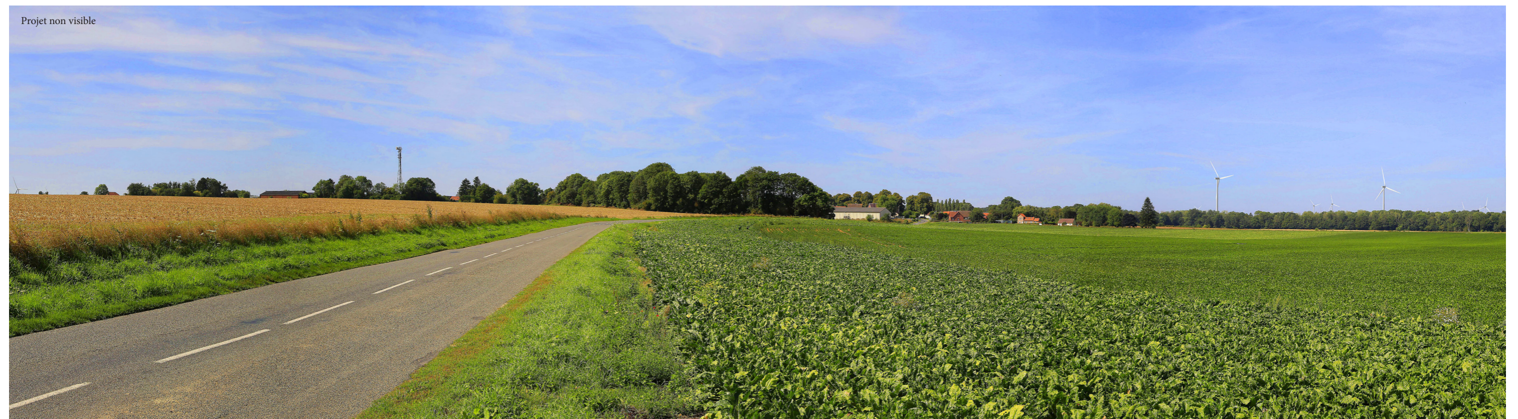
Photomontage - panorama à 90° (parcs existants, accordés, en instruction et projet)

En rose : projet étudié, En bleu : parcs existants, En vert : parcs accordés, En jaune : parcs en instruction et déposés