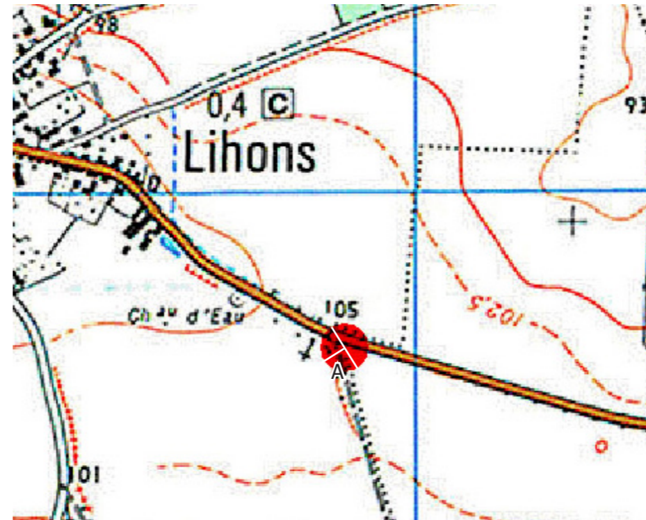
Carte de localisation du photomontage sur scan 25 (Sens de rotation du panorama : gauche à droite)