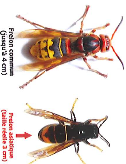
Frelon commun (jusqu'à 4 cm)