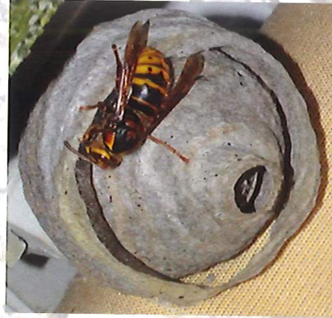
Nid primaire de frelon européen

Le nid primaire du frelon asiatique héberge 20 à 30 insectes. Il est généralement construit dans un endroit abrité à hauteur d'homme (ruche vide, cabanon, trou de mur, bord de toit, roncier...). L'orifice de sortie est situé à la base.