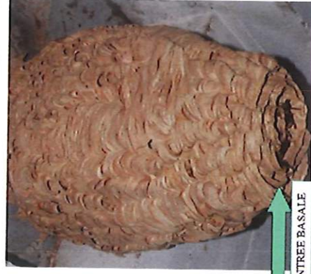
Nid secondaire – frelon européen

L'orifice de sortie est petit et situé latéralement sur le nid.