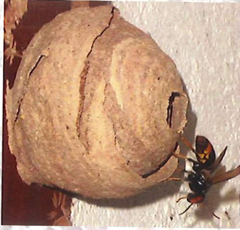
Nid primaire de frelon asiatique

Le nid primaire du frelon asiatique héberge 20 à 30 insectes. Il est généralement construit dans un endroit abrité à hauteur d'homme (ruche vide, cabanon, trou de mur, bord de toit, roncier...). L'orifice de sortie est situé à la base.