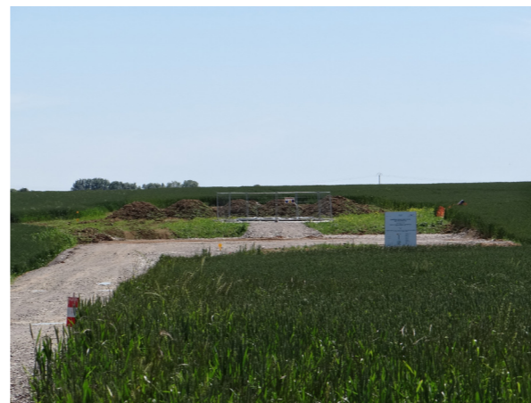
Fig. 11. Parc éolien en construction de Fresnoy-Andainville, Arguel, Andainville et Saint-Maulvis