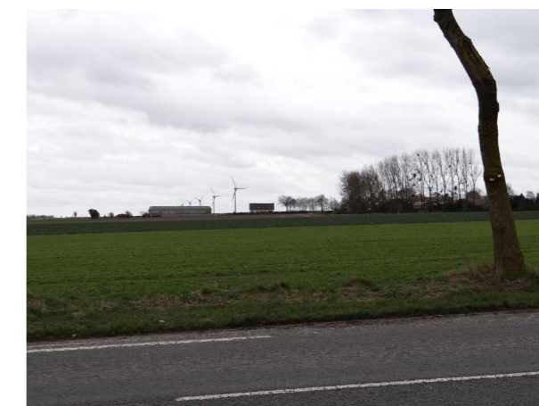
Fig. 12. Parc éolien de Rambures et Bouillancourt-en-Séry vu depuis la RD928 à l'Est de Framicourt

Les vastes plateaux agricoles, ouverts et bien exposés aux vents sont des secteurs attractifs pour l'accueil de parcs éoliens. Ainsi de nombreux projets éoliens ont déjà été développés dans l'aire d'étude éloignée. Les parcs éoliens inventoriés sont présentés sur la carte 7 et dans les tableaux ci-contre (données juillet 2016, source : Ostwind d'après DDT80, DREAL Picardie, DREAL Haute Normandie, Google Earth).