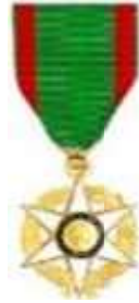
Ordre du Mérite Agricole