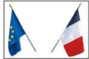
Nombre pair Préséance du drapeau français, puis européen