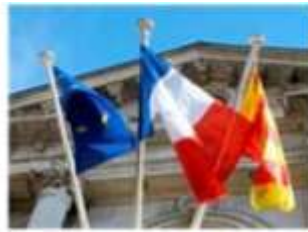
Nombre impair Préséance du drapeau français, puis européen, puis régional