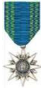
Ordre du Mérite Maritime