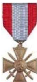
Croix de Guerre Théâtres d'opérations Extérieures