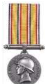
Médaille d'honneur des Sapeurs-pompiers