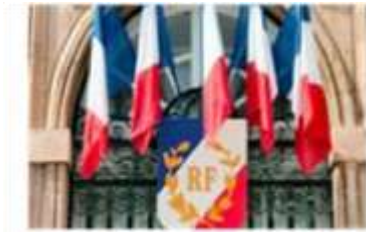
Nombre impair Pavoisement uniforme aux couleurs Nationales