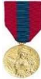
Médaille de la Défense Nationale