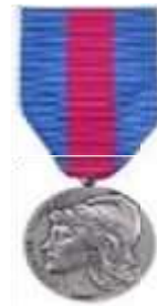
Médaille des Réservistes Volontaires de Défense et de Sécurité Intérieure